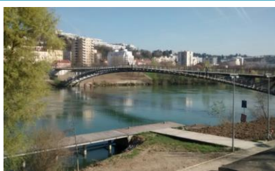
Passerelle De La Paix